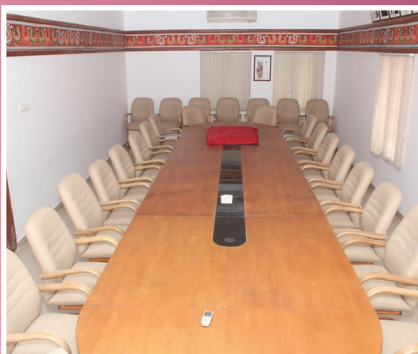
GODAVARY CONFERENCE HALL